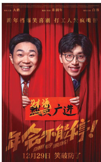
《年会不能停！》海报。