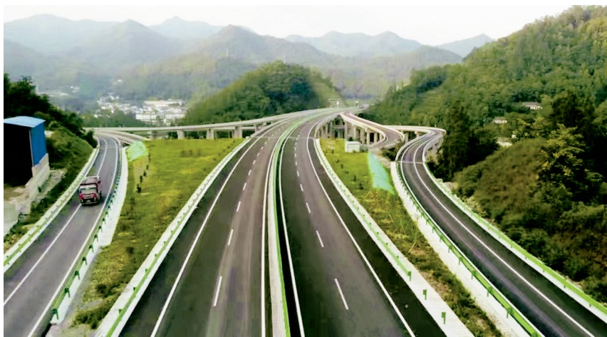
即将通车的广平高速。

广平高速项目起于青川县骑马乡，止于平武县母家山，全长89.776公里，采用设计速度80公里/小时、双向四车道高速公路技术标准建设。广平高速全线建成通车后，国家高速公路网北京至昆明、兰州至海口、绵阳至九寨沟和广元至恩施等高速公路将连为一体，成为川陕甘交通枢纽的又一骨干性支撑工程，是西北地区进出九寨沟最便捷的通道之一。