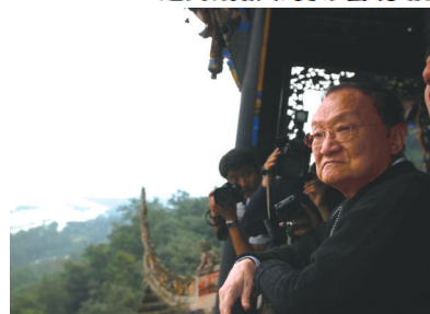
书中金庸2004年9月参观都江堰水利工程的照片。