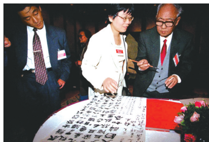
书中汪曾祺(右一)1997年5月参加笔会时的照片。