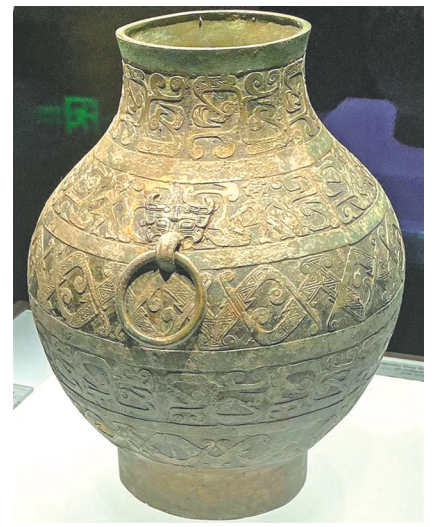
舞人与兽纹铺首衔环耳青铜壶。