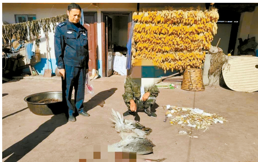
吉克某某将黑颈鹤猎捕后杀害。

目前，犯罪嫌疑人吉克某某因涉嫌危害珍贵、濒危野生动物罪，已被公安机关依法刑事拘留，案件正在进一步侦办中。