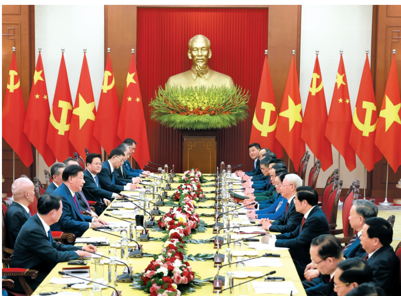
当地时间12月12日下午，刚刚抵达河内的中共中央总书记、国家主席习近平在越共中央驻地同越共中央总书记阮富仲举行会谈。