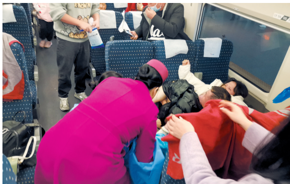
▲车厢里搭起“临时产房”。