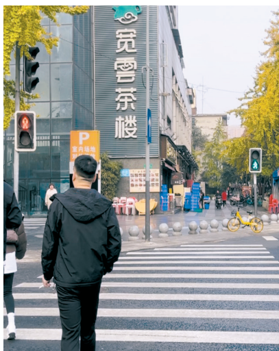
两个人行信号灯一红一绿同时亮起。

近日，华西都市报、封面新闻云求助热线接到市民反映：在成都市锦江区双栅子街和梓潼桥正街间的十字路口，遭遇红绿灯“打架”，一侧斑马线出现了两个同方向的信号灯，一红一绿竟同时亮起，把过往行人给整懵了，“不知道到底能不能通过。”