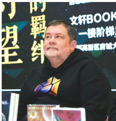
谢尔盖·卢基扬年科

谢尔盖·卢基扬年科是当代俄罗斯科幻的代表人物，近年来，由八光分文化联合新星出版社推出的“谢尔盖·卢基扬年科经典科幻系列”陆续向中国读者译介了这位俄罗斯科幻大师的代表作，包括《星星是冰冷的玩具》《深潜游