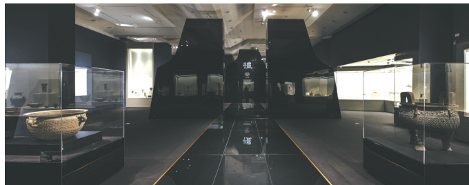
“礼运东方——山东古代文明精粹”展览现场。

清华艺博结合各地历史文化底蕴,用文物讲好古代文明故事,2019年与陕西省策划了“与天久长:周秦汉唐文化与艺术特展”,2021年和山西省合作了“华夏之华:山西古代文明精粹”展览。此次经过长达两年的策划,清华艺博与山东省博物馆、孔子博物馆、山东省考古研究院等50余家文物机构携手,通过展览将山东古代文明系统、完整地呈现在了观众面前。