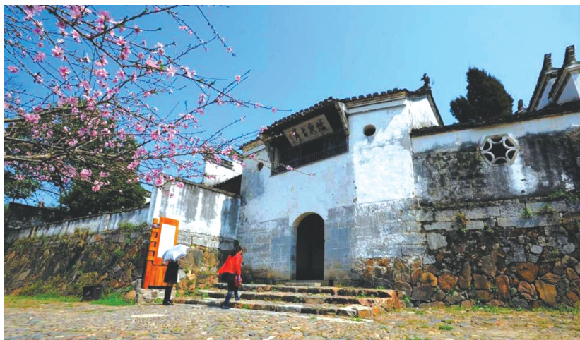
位于桃花潭东岸古渡口的踏歌岸阁,据传是当年汪伦送别李白处。