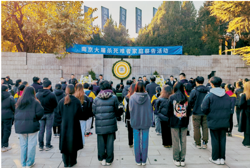
第十个国家公祭日到来前，南京大屠杀死难者家庭祭告活动12月3日正式启动。