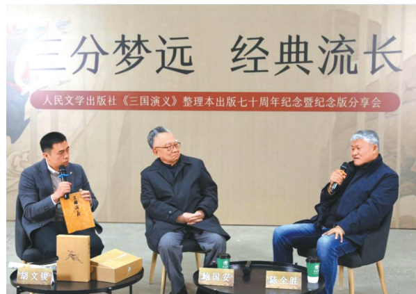
《三国演义》下半场对话。

《三国演义》是长篇章回体小说的开山之作，也是中国古代历史演义小说的代表作，问世以来，对中国人的思维、生活等多方面有着深远影响，至今仍是阅读热点之一。