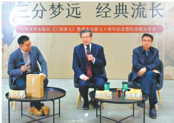
《三国演义》上半场对话。插图本，七十周年纪念版。