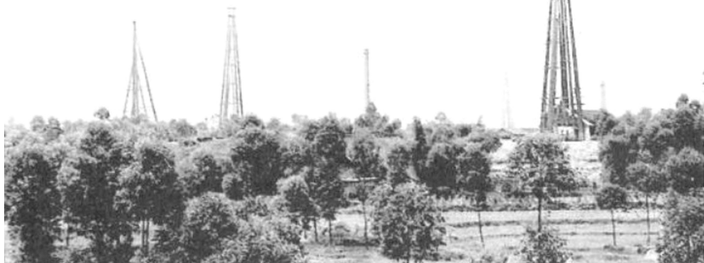
旧时富顺邓井盐场的盐井天车。