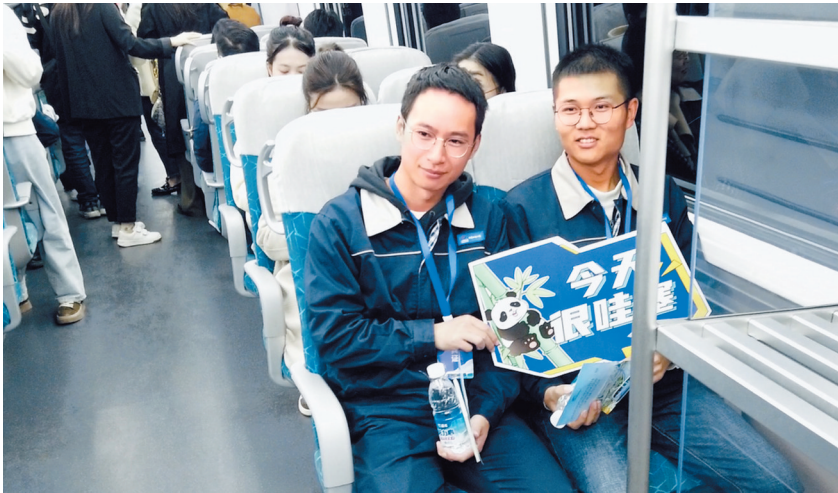
市民参加成都地铁19号线二期试乘活动。

亭低位可同时服务付费区和非付费区，还设置了乘客呼叫按钮，满足票亭无人值守时，乘客需求一键响应。