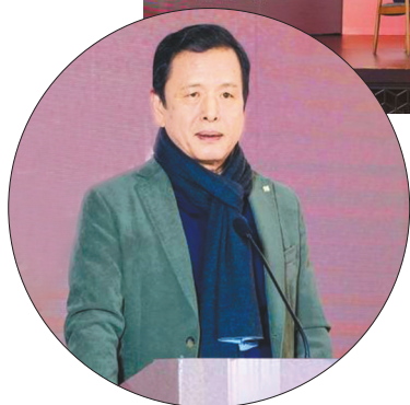
李敬泽在新时代文学跨界传播论坛上致辞。