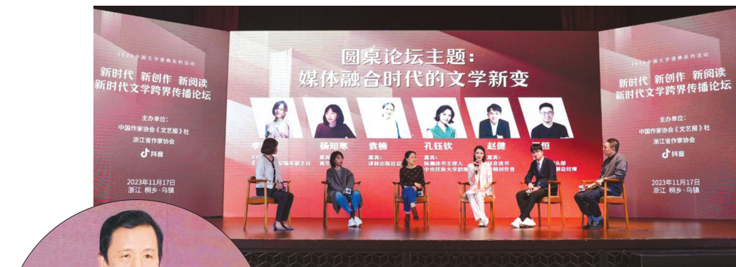
新时代文学跨界传播论坛之圆桌论坛。

11月17日晚,在古老的乌镇,“2023中国文学盛典系列活动”之一,“新时代文学跨界传播论坛”在此举行。来自文学、出版、互联网短视频平台等多个领域的人士在论坛上分享交流,讨论文学跨界的可能性以及破圈给文学带来的意义。现场还启动了新时代文学数字传播计划,旨在助力新时代文学多形式表达、多渠道传播,让广大读者发现更多优秀作品,让广大作家找到更多理想读者。