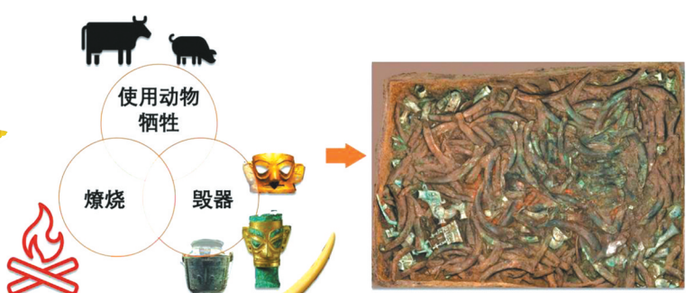
有机残留物结果反映的祭祀坑形成前仪式三要素。