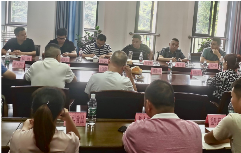
芦山经开区服务企业座谈会。

自第二批主题教育开展以来,芦山就把学习推广“四下基层”作为服务企业推动发展的重要抓手。组织企业现场问需、有关部门“一对一”服务、单位部门把办公室搬到企业面前……当地希望通过坚持眼睛向下、工作前移和热忱服务,能推动当地企业共享实惠共谋发展。