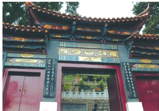
昆明升庵祠门柱上的对联。