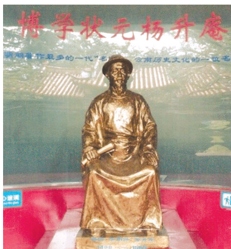
昆明升庵祠内杨升庵塑像。

升庵对云南边疆的山川、风物、气候、民俗接触多,耳闻目睹,感受至深。这些自然和人文景观以及各族人民多姿多彩的生活,向他展示了远离宫廷后的神奇世界,激发他创