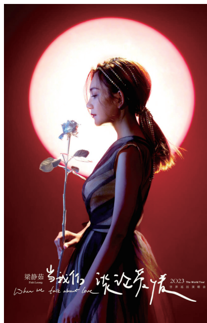
梁静茹演唱会成都站海报。图据梁静茹微博