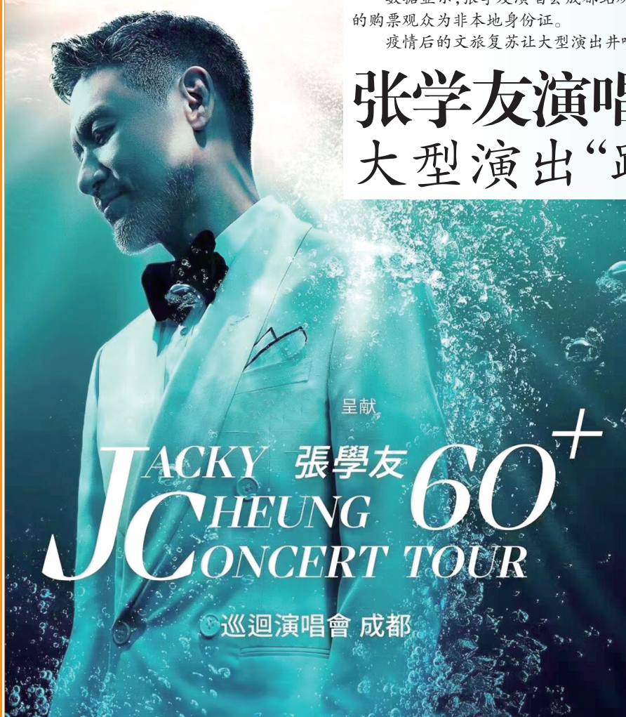
张学友巡回演唱会成都站海报。