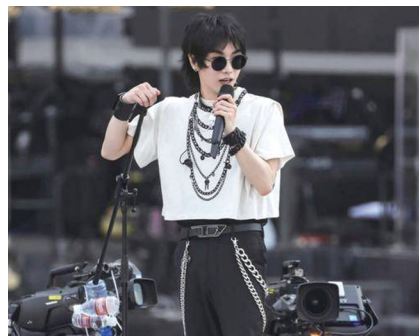
华晨宇今年“五一”在成都连开三场演唱会。

即便如此,在“强实名”票务管理的当下,依然不乏“抢票难”“抢票贵”的呼声。有网友表示,“强实名”之后抢到票的概率并没有提高,许多热门场次依然是“一秒售罄”,并且依然可以向“黄牛”提供身份证等信息进行“代买”,但是需要付出比原票价更多乃至翻倍的加价。