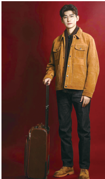
张翰在《如梦之梦》中饰演“五号病人”。