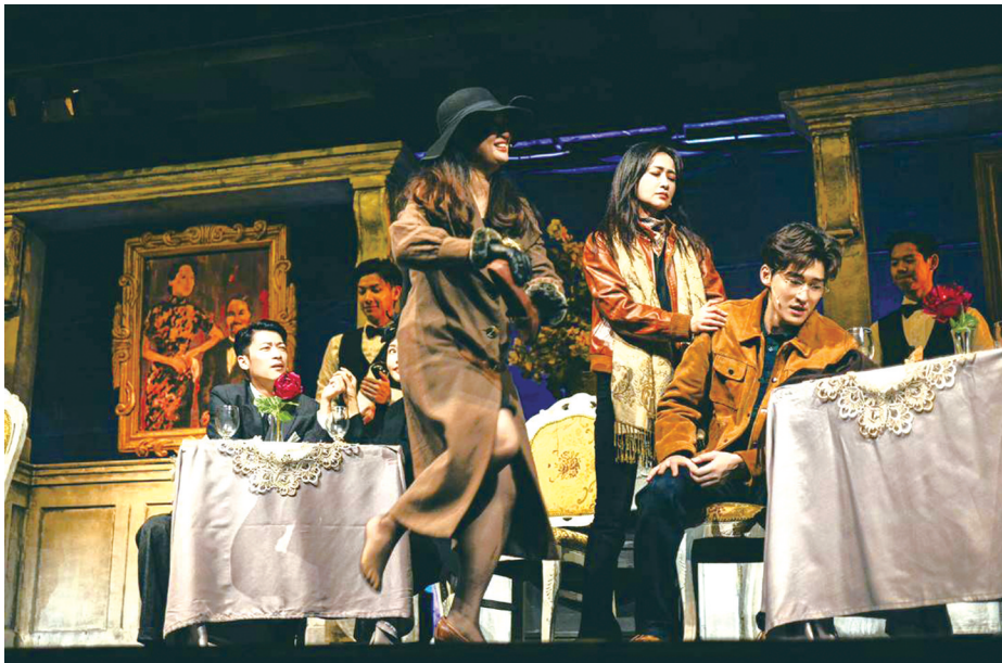
话剧《如梦之梦》剧照。

“五号病人”出场后的每一场戏，都面临着人生中非常重大且不可逆转的遭遇。相邻的两场戏中间是没有常规戏剧过程的，如何诠释每场戏之间的情绪转折和不同情绪间的精准衔接，对我而言都是一个很大的挑战。