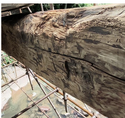
接龙桥的桥梁由整棵皇柏树修建而成。

据南江县文物资料记载：接龙桥始建于清末，石墩木梁廊桥，南北横跨小河沟，长39米、宽5.5米，屋脊至水面通高10米，桥栏高1.1米。桥面有穿斗梁架、青瓦屋面桥廊，桥面铺放规格木板，规格条石砌桥墩。桥廊木檩上墨书“民国二年”“民国三十七年”题记，桥北有1983年培修接龙桥碑记。说明该桥在民国二年（1913年）、民国三十七年（1948年）、1983年曾三次培修过。