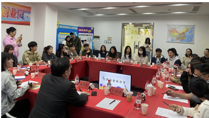
▲ 11月4日,两岸青年博主参访成都海峡青年创业园,举办交流座谈会。