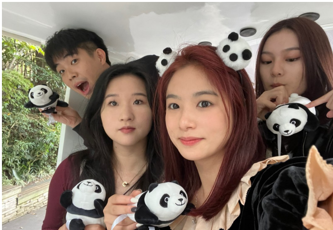
▲ 11月1日,“熊猫相伴 同心同行”两岸青年博主成都行活动在成都大熊猫繁育研究基地启动。