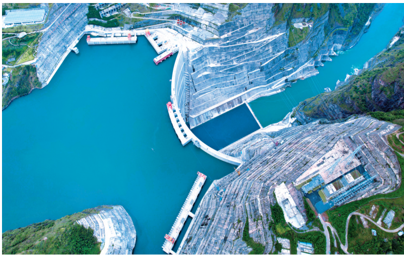
10月12日拍摄的白鹤滩水电站。

白鹤滩水电站共安装16台100万千瓦水轮发电机组,机组水力设计、电磁设计、通风冷却、高性能材料研发应用达到世界领先水平。白鹤滩水电站首批机组于2021年6月28日投产发电,2022年12月20日全部机组投产发电。白鹤滩水电站投产以来,绿电输送长三角地区,为我国实现“双碳”目标、促进经济社会发展全面绿色转型作出重要贡献。