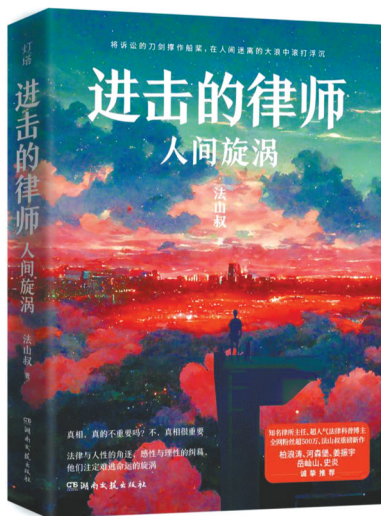
《进击的律师：人间旋涡》

法山叔，是全网关注度超500万的人气法律科普博主，其发布的法律内容年阅读量据称已突破6亿，视频年播放量更是高达5000万。法山叔也是一位专业人士：从业八年跃升为律所主任，不仅在专业度上得到业内的高度认可，他还善于将丰富的实践经验、娴熟流畅的文笔和构思新颖的想象力结合起来，创作出精彩的法律小说。他已出版的小说《进击的律师：双子星升起》和《进击的律师：幽暗线索》，都受到大量读者的喜爱。