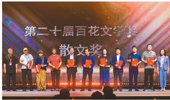
散文奖获奖者上台领奖。