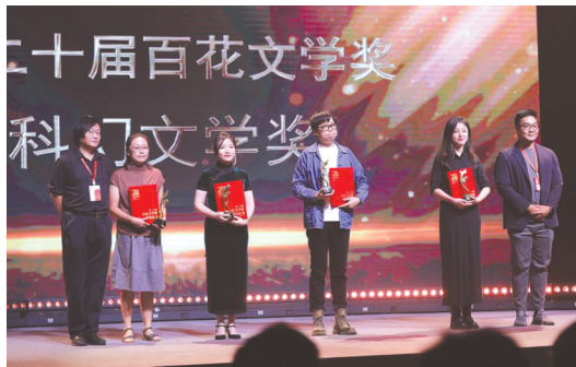
科幻文学奖获得者上台领奖。