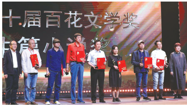
中篇小说奖获得者上台领奖。