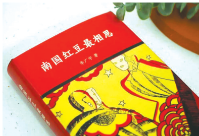
李广宇作品《南国红豆最相思》。

叶灵凤(1905年-1975年)这个名字,很多人都是从鲁迅那里知道的。两人曾打过一场又一场笔墨官司。其实,叶灵凤是一位全才型的宝藏人物,在他身上,还有大量值得全面、深入挖掘和了解的东西。