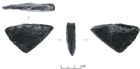
和龙大洞遗址出土的细石叶石核。