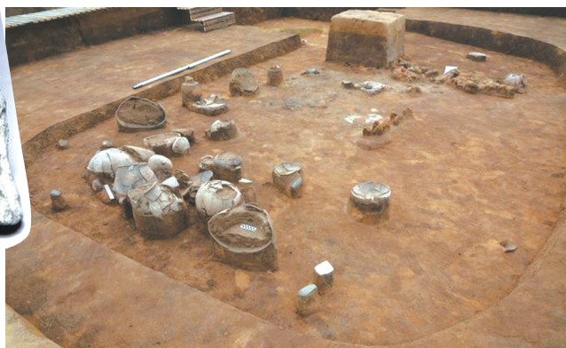
马鞍桥山遗址祭祀坑JK1全景。