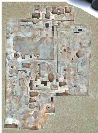
金中都大型建筑基址全景图。