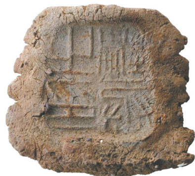
邾国故城遗址出土的西汉晚期“骑丞之印”封泥。