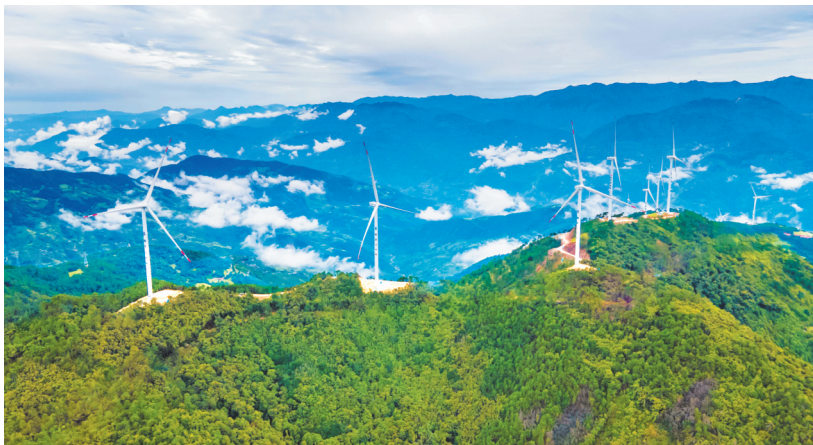
雅砻江腊巴山风电场。

为高质量推进项目建设,雅砻江公司在腊巴山风电项目深入推进设计施工总承包(EPC),实现设计、施工深度融合。在项目设计阶段,雅砻江公司联合参建各方对风机基础型式、升压站布置、吊装平台、集电线路等多方面开展设计深化,风机基础浇筑混凝土较同类型减少约20%,温度控制更加可靠;相较同类工程,吊装平台挖填量和用地节约30%,输电设备施工用地节约30%。同时,构建现场质量管理体系,加强风机基础开挖、接地埋件、混凝土浇筑等全链条质量管控,从“人、机、料、法、环”等各个方面全过