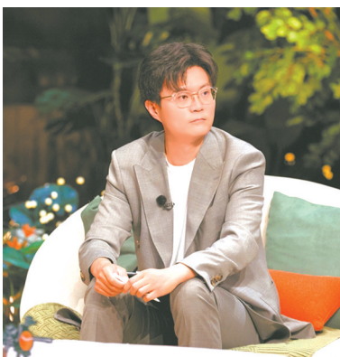
观察室嘉宾李松蔚是北京大学心理学博士。