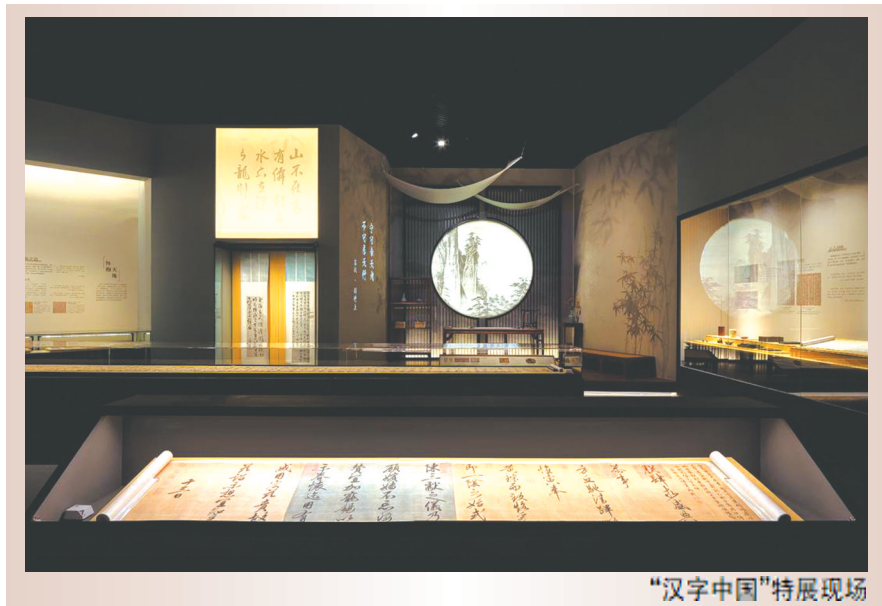
“汉字中国”特展现场