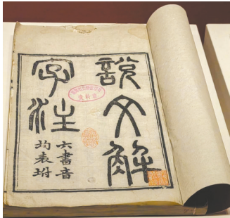
段玉裁注《说文解字》

散乱的金箔、青绿色的纸本……正在展出的“汉字中国——方正之间的中华文明”展览上，出土于成都市群众路唐墓、现藏于成都文物考古研究院的纸本真言，用文字和形式，印证了佛教文化在唐代的传播与变化。