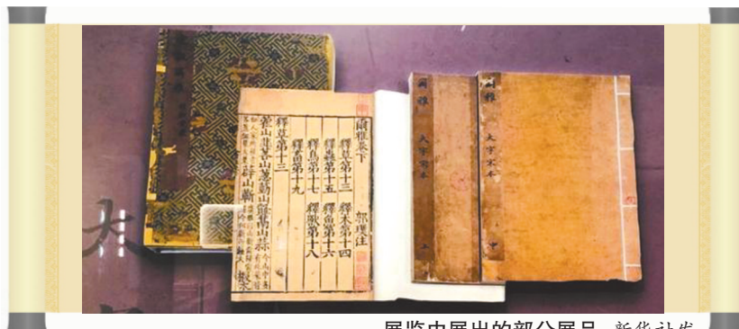
展览中展出的部分展品