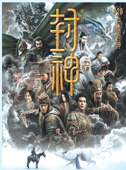
《封神第一部：朝歌风云》海报

面对日益成熟的观众，国产电影无论是题材还是叙事手法方面，都在累积成功经验，尤其是对于社会现实的关照，成为了暑期档的亮点。