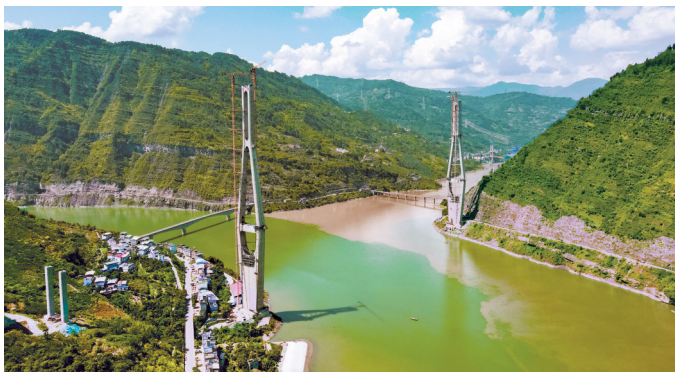
8月10日,新市金沙江特大桥主塔完成封顶。

新市金沙江特大桥作为目前四川省内同类型在建规模最大的钢桁梁斜拉桥,在建设过程中坚持“智慧”“绿色”理念,以技术创新、智能建造赋能工程