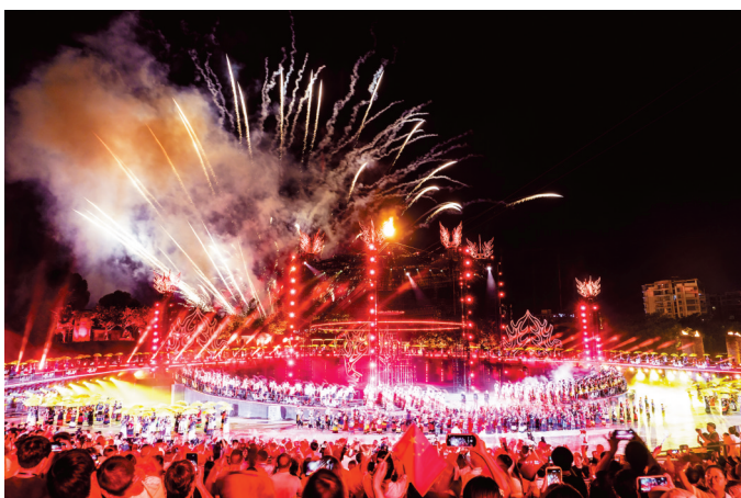
8月10日晚,2023年第八届凉山彝族火把节暨夏季清凉凉山游系列活动在凉山州西昌市火把广场开幕。

晚上8点半,在西昌城区的春栖大道,熊熊的篝火点燃后,游客们高声欢呼,现场成为一片欢乐的海洋。音乐响