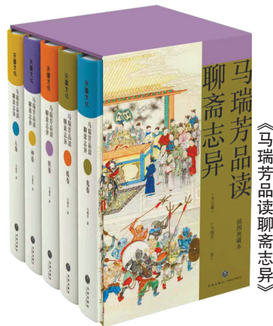
《马瑞芳品读聊斋志异》

在分享会上，天地出版社社长杨政谈到，天地出版社近几年一直致力于推广和普及优秀传统文化，出版了不少叫好又叫座的传统文化融媒体图书，比如《王蒙讲孔孟老庄》《张其成讲易经》《齐善讲道德经》《黄朴民讲孙子兵法》等。马瑞芳是国内首屈一指的权威学者，她结合自己丰富的人生阅历，将数十