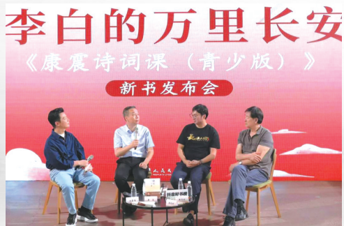
濮存昕、于洲、康震、任鲁豫(从右到左)亮相新书发布会。