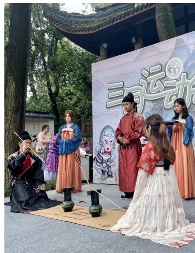
“三国运动会”活动现场。

有趣的是，根据现场的游戏规则，观众在参与每个体验项目并且通关后，可收集到对应项目的印章，集齐一定数量的印章后可兑换精美的文创礼品。现场许多观众摩拳擦掌、跃跃欲试，场