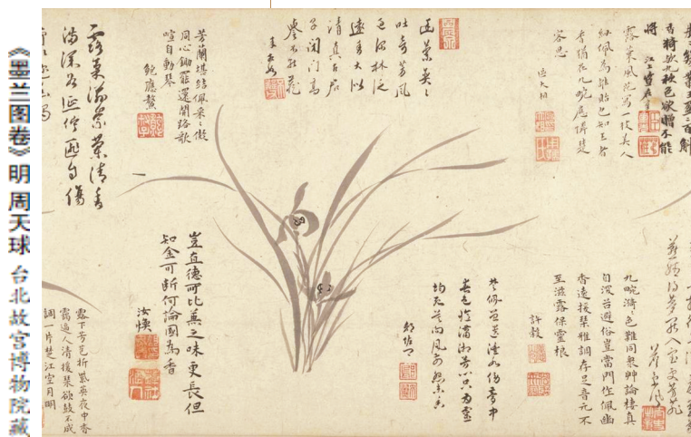
《墨兰图卷》明周天球 台北故宫博物院藏