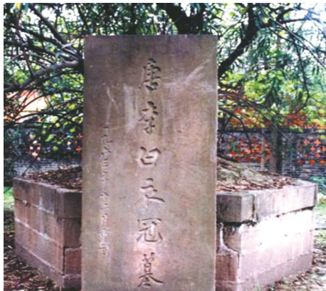
李白衣冠墓建于清同治八年，后倾圮。现存之墓系1963年重修。