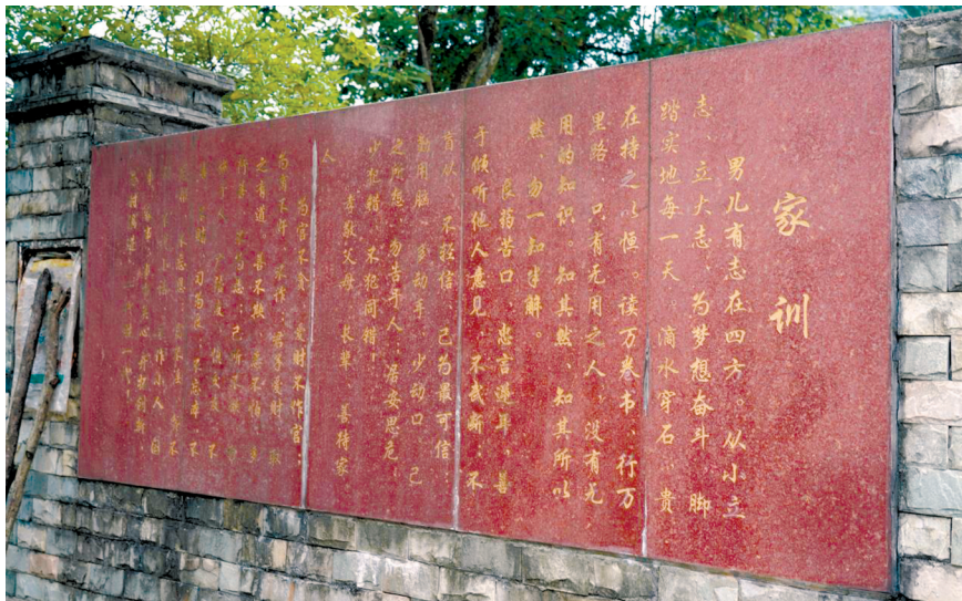
陈氏家族后人将家规刻在石板上。