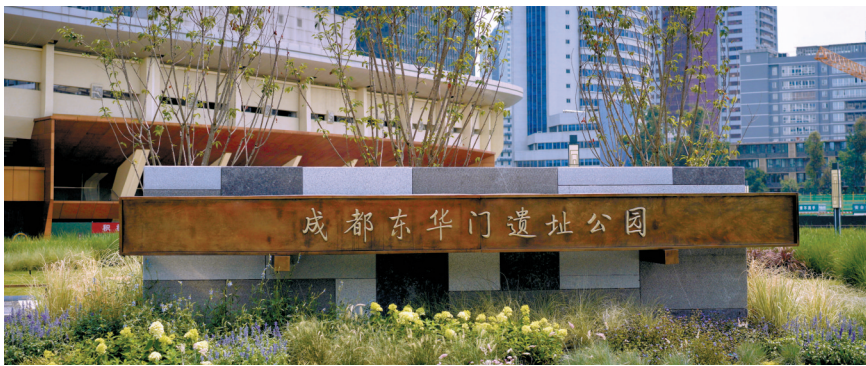
东华门遗址公园外场遗址区将于7月20日正式开放。

2013年,是成都体育中心发生重要转折的时间点。在场馆改造提升工程建设中,发现了秦汉至明清2300年历史文化遗存,随即展开了大规模考古工作。至2019