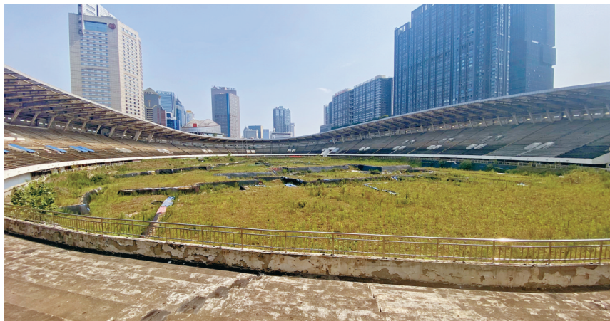
体育场内遗址保护展示正在加紧推进当中。

在东华门遗址公园,一道长长的“水渠”非常显眼。一个显示牌写着:明代蜀王宫水道踏道遗迹。