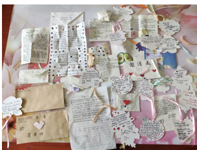
孩子们给苏正民写的信。