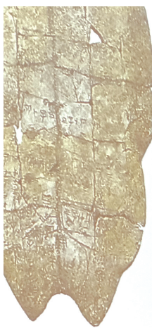
河南安阳殷墟花园庄出土甲骨文字

在孙华看来，中国汉字体系至迟在商代形成，是各方面的动因所促成。其中，商人非常迷信，事无巨细都要占卜，往往一件事要多次看其是吉还是凶，并根据占卜的结果来决定是否从事某件事。于是，形成了一支数量颇为可观的专业神职人员，为了不发生混淆和遗忘，他们将每次占卜结果记录下来以备查验，就是一种必要的需求。这些人扩充了符号的数量，还将特定的符号与语言中的特定词汇对应起来。“这样的符号系统