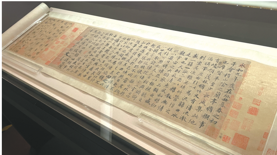
“汉字中国”特展中的赵孟頫临《兰亭序》。