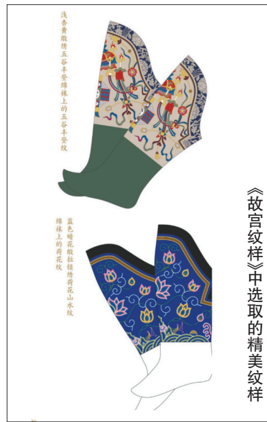
《故宫纹样》中选取的精美纹样

一“自然之美”“物我两忘”等内涵构成了中国传统审美文化的重要特征，人与自然和谐共处的心理随着精神文化的富有不断强化、延伸，整个民族的审美文化都受到主流影响，中国传统纹样中的祥瑞内涵也愈加深重。时至明清两代，祥瑞观念已达到鼎盛，“图必有意，意必吉祥”真实地表达了中国传统纹样装饰的文化基因。在故宫博物院中，藏品上林林总总的纹样，其实也是美好的纹样、吉祥的纹样。