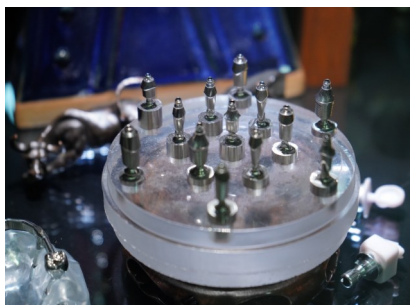
“中国牙谷”内的一家种植超精密加工生产企业的样品展示。

《决定》中用了“特色鲜明、质量优异”这两个新词，当地将坚持先做强再做大，把质量和效益放在第一位，充分用好区位优势、交通优势、资源优势、政策优势，集中资源重点突破，主攻方向是发展特色优势产业和战略性新兴产业。功能定位即建设“六基地、一目的地”，具体为医疗器械产业基地、交通装备产业基地、清洁能源生产转化基地、先进材料产业化生产基地、国防科技工业基地、成渝绿色食品供给基地和成都都市圈近郊游目的地。