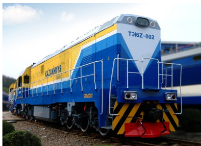
出口哈萨克斯坦的“资阳造”机车。