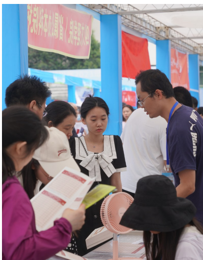
考生和家长正在咨询。