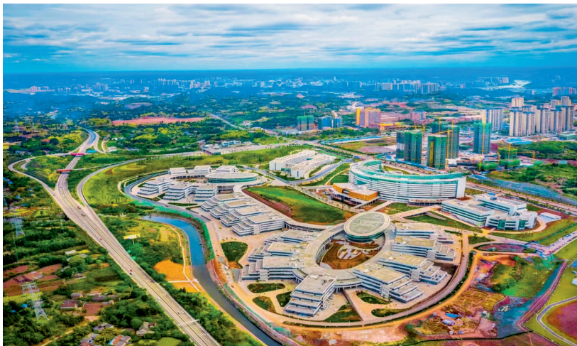
资阳中国牙谷(航拍图)。

此外，去年11月召开的省委十二届二次全会也提出，要着力推进五区共兴，建强现代化成都都市圈、提升区域中心城市能级、强化重要节点支撑功能，构建优势互补、高质量发展的区域经济布局，川中四市也是我省区域