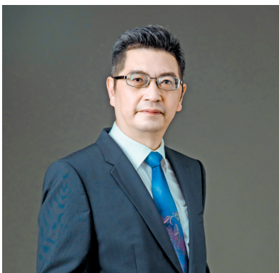
西南交通大学区域经济与城市管理研究中心主任、四川省区域经济研究会会长戴宾