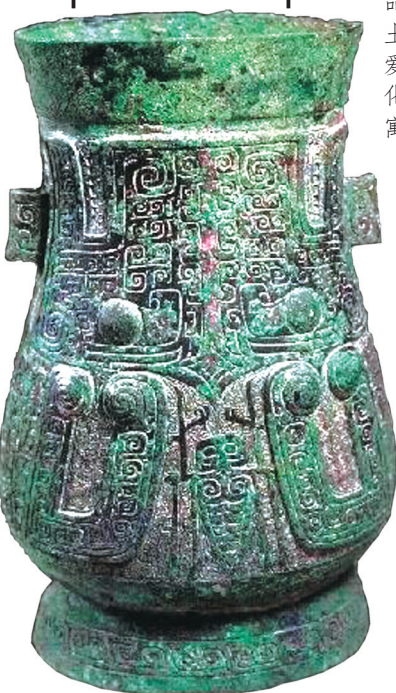
商晚期晋面纹壶上有蝉纹