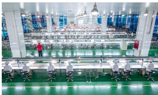
剑南春产品灌装包装线。

剑西酒业于2020年完成新厂区收购技改,年产值可达8500万元,2022年销售额同比增长15%。未来3年,剑西酒业将建设物流中心、工业白酒旅游集散地、酒文化博物馆。