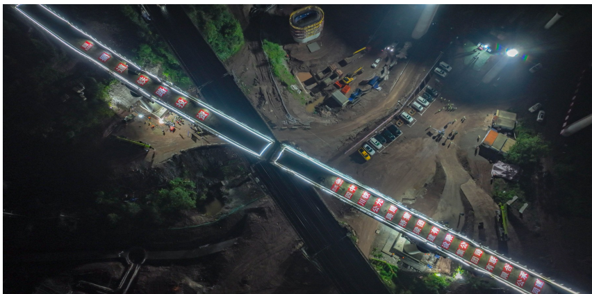
汉巴南铁路跨兰渝铁路大桥转体施工现场。

员各司其职,全方位监控梁端高程变化、风力变化及检查转铰结构部位是否异常。转体过程中采用“可视化BIM转体监控系统”实时动态监测各项关键参数,确保转体精准到位。