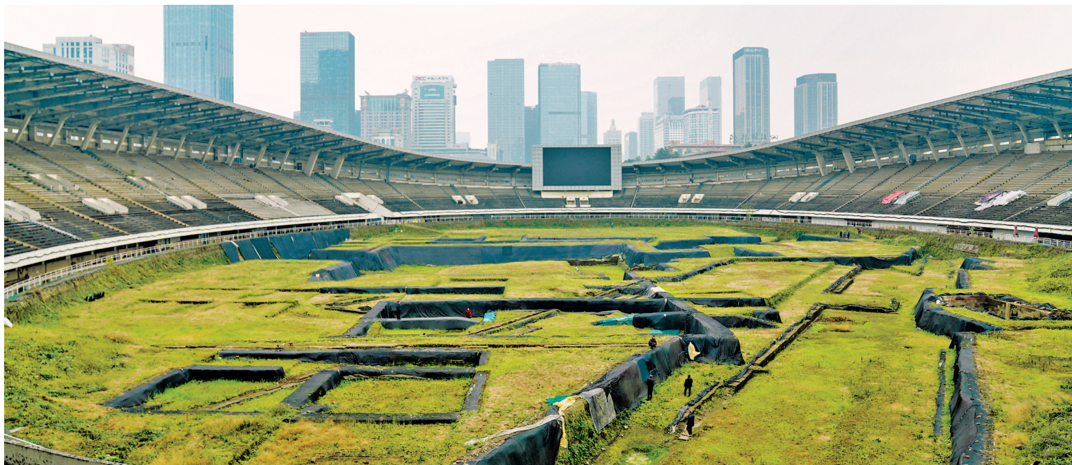
东华门遗址发掘——体育场内场。