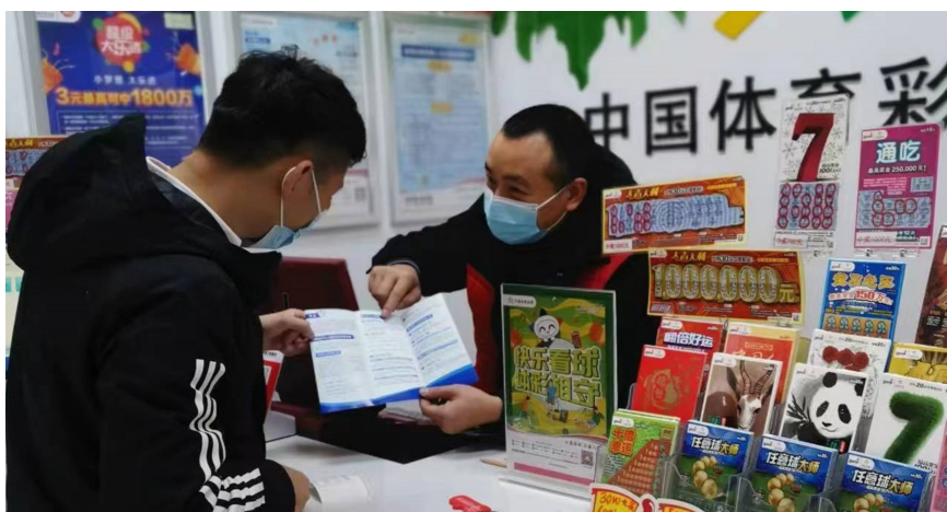
购彩者在泸州一家由退伍军人经营的体彩代销点咨询。

2023年是全面贯彻党的二十大精神开局之年。四川省体育彩票管理中心坚定以习近平新时代中国特色社会主义思想和习近平总书记来川视察重要指示精神为指导，深入贯彻落实“安全发展”工作总思路，推动四川体彩渠道高质量创新发展再上新台阶，为民生就业不断注入体彩公益力量。